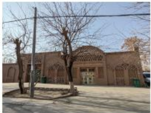
新建建筑风貌延续