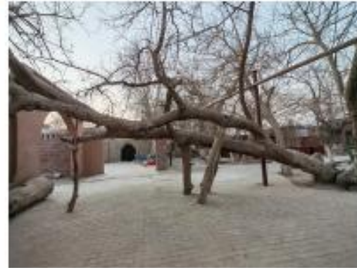
人与自然和谐共生