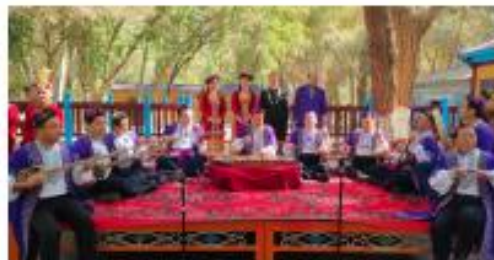
世界非遗木卡姆演绎