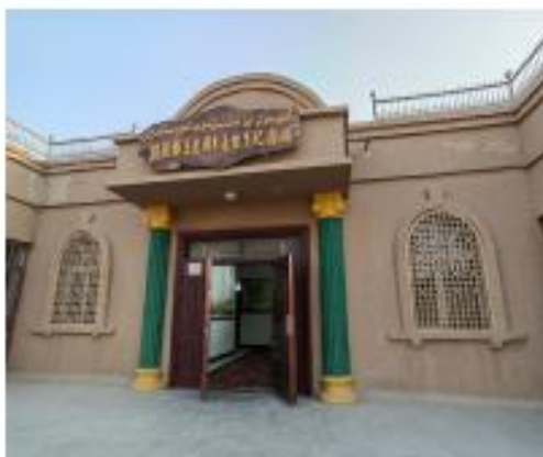
爱国主义教育基地