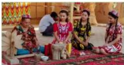
国家非遗艾德莱斯制作