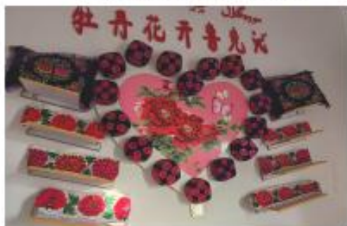
象征民族团结的“牡丹花花帽”（自治区级非物质文化遗产）