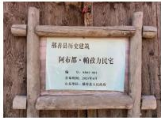
传统建筑分类保护